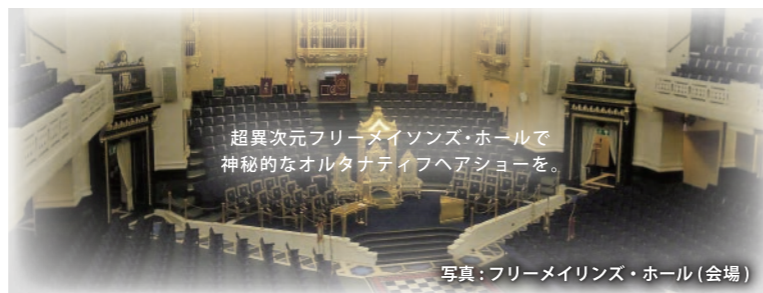
写真：フリーメイソズ・ホール(会場)

※チケットのみのご手配の場合、上記金額に対し10%の手配手数料をいただきます。 ※本年は2回公演となっております。